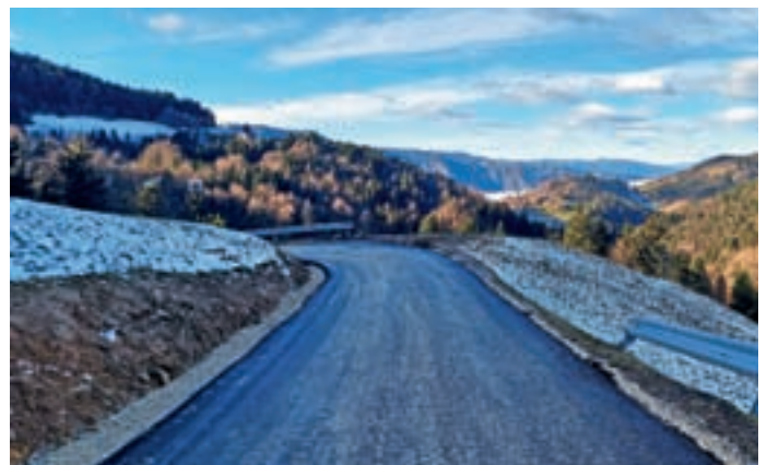
Obnovljeni odsek ceste v Javorjevem Dolu

Sanacije ceste v Javorjevem Dolu so se tako lotili v sklopu obnove po poplavih, in sicer so na novo uredili 1,2 kilometra dolg odsek, cesto pa so na tem delu tudi nekoliko razširili, je pojasnil Boštjan Kočar iz oddelka za okolje, prostor in infrastrukturo. V sklopu obnove so uredili tudi 15 cestnih prepustov in poskrbeli za odvodnjavanje meteornih voda, ki se razlivajo po okoliških