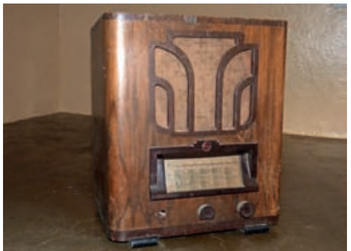
Radijski sprejemnik Philips 525A – 23 je star skoraj 90 let.

Radio je bil pred prihodom druge medijske tehnologije pomemben vir informacij in tudi razvedrila. Podjetje Philips sta ustanovila Frederik in njegov sin Gerard Philips v nizozemskem mestu Eindhoven leta 1891. Tam so izdelovali tudi modele 525A. Sprva so izdelovali samo električne žarnice, nato je sledil razvoj v obsežno mednarodno družbo, ki je postala eden največjih svetovnih proizvajalcev na področju elektronike. Med nemško okupacijo Nizozemske v času druge svetovne vojne je vodstvo družbe zbežalo v ZDA, kjer so ustanovili severnoameriško podružnico, tja so prenesli tudi večino kapitala, sedež podjetja pa so prestavili na Nizozemske Antile v Karibskem morju, ki so bili del nizozemskih kolonij. Trenutno družba Philips zaposluje več kot 120 tisoč ljudi v 60 državah. Leta 1939 so začeli proizvodnjo električnih brivnikov, po drugi svetovni vojni so razvili kompaktno avdio kaseto (s trakom), leta 1972 so začeli proizvodnjo kasetnih videorekorderjev, leta 1982 pa so skupaj z japonsko družbo Sony razvili kompaktni disk (CD). Leta 1998