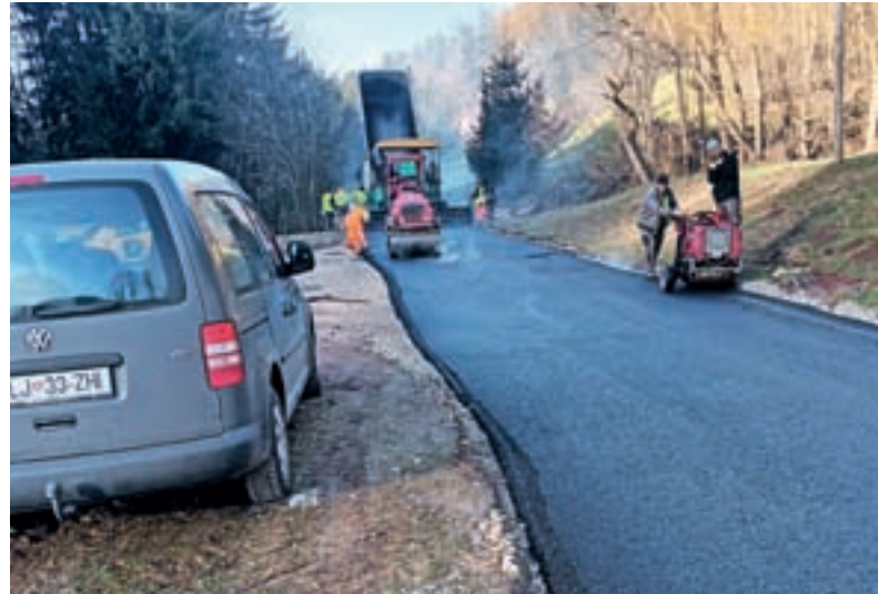
Asfaltirani so bili številni cestni odseki.

V počastitev slovenskega kulturnega praznika smo 8. februarja organizirali proslavo v kulturni dvorani. V aprilu smo s pomočjo društev v naši krajevni skupnosti izvedli vsakoletno očiščevalno akcijo. Poleg pobiranja odpadkov po vodotokih in ob cestah je potekala tudi akcija čiščenja podstrešja v zadružnem domu. Na predvečer dneva državnosti smo v Novi Oselici poskrbeli za organizacijo slovesnosti v počastitev dneva državnosti. Na področju prometne infrastrukture je z občinskimi sredstvi potekala obnova LC Sovodenj–Stara Oselica–Ermanovec, kjer je bilo položeno več kot dva kilometra asfaltne prevleke. Dela na tem odseku še niso končana, k čemur so veliko pripomogle poplave v avgustu, nadaljevala se bodo letos. Zaradi katastrofalnih poplav in plazovitega terena je prišla na vrsto tudi prenova okrog 1200 m dolgega odseka LC Sovodenj–Javorjev Dol–Ledinsko Razpotje, kjer so bili urejeni tudi oporni zidovi. Prenovljen je bil tudi most na JP Laniše–Rupe–Lisjak. Poleg rednega letnega vzdrževanja lokalnih cest in javnih poti so bili urejeni na novo z asfaltno prevleko: 250 m dolg odsek JP Sovodenj–Stara Oselica–Vrhovc, 150 m dolg odsek JP Sovodenj–Koreninar in 100 m dolg odsek JP Pirc–Likarjeva bajta. Po poplavah v avgustu je potekala tudi solidarnostna akcija, kjer