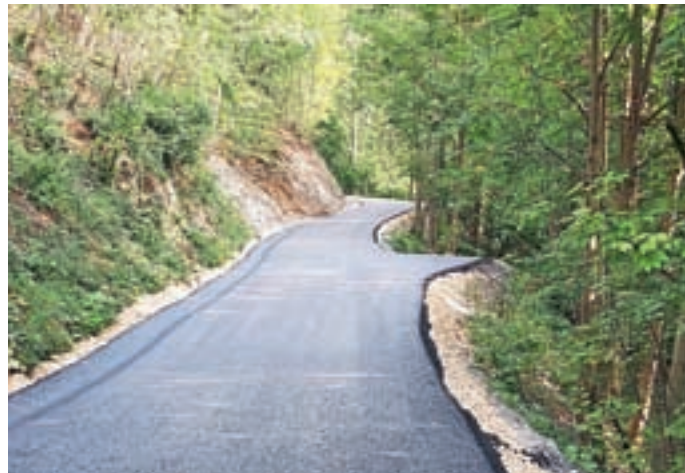
Asfaltiranje javne poti Čabrače–Zarobar

Zaradi pozne sklenitve pogodbe s podjetjem, ki bi poskrbelo za asfaltiranje v letu 2022, se je sanacija lokalne ceste Gorenja vas–Žirovski Vrh v dolžini 570 m izvedla v letu 2023. Vse leto se je izvajalo redno vzdrževanje lokalnih cest in javnih poti. Na pokopališču Gorenja vas so se izvajala nujna vzdrževalna dela.