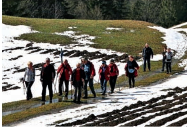
Prvi pohod v novi, že deseti sezoni bo Zimski pohod.

Pohodi niso pretirano težki, a je malico, ki jo pohodniki dobijo na pohodih in je vedno dobra in domača, vseeno treba »zaslužiti«. Tako kot že v lanskem letu tudi letos pripravljajo pohod, ki bo namenjen predvsem otrokom in se bo zaključil ob kresu pri koči na Starem vrhu, morda celo z novo pravljico za najmlajše. S pohodom se bo začel tudi najbolj prazničen dogodek v društvu – Dan oglarjev. Seveda pa je eden od pohodov namenjen obisku poljanskega očaka Blegoš, in sicer junija, ko je Blegoš v najlepšem cvetju. Ostaneta še dva pohoda, tradicionalni Javorje–Žetina–Javorje in Jesenski pohod. V društvu imajo pripravljen program in upajo le še, da jim bo vreme dobro služilo, četudi so pohodniki vajeni vseh vremenskih razmer. A kraji pod Starim vrhom so znani po tem, da imajo največ sončnih dni v letu in kot takšne jih svojim obiskovalcem tudi najraje pokažejo.