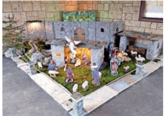
Jaslice pri cerkvi sv. Martina v Poljanah so bile letos postavljene zunaj, ker so v cerkvi potrebovali prostor za potrebe prenosa polnočnice na RTV Slovenija.