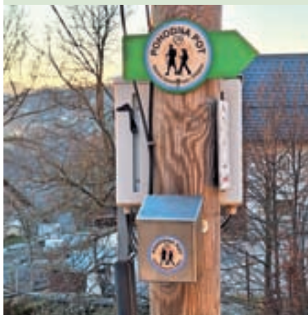
Občinski pohodni krog

Kontrolni žig Ograde (KT7) občinskega pohodnega kroga občine Gorenja vas - Poljane je iz Ograd prestavljen v Leskovicu na leseni elektro drog ob cerkvi svetega Urha. Prav tako je premaknjena kontrolna točka Okrepčevalnica Matija (KT3) kolesarskega kroga Občine Gorenja vas - Poljane na Kulturni dom Lučine.