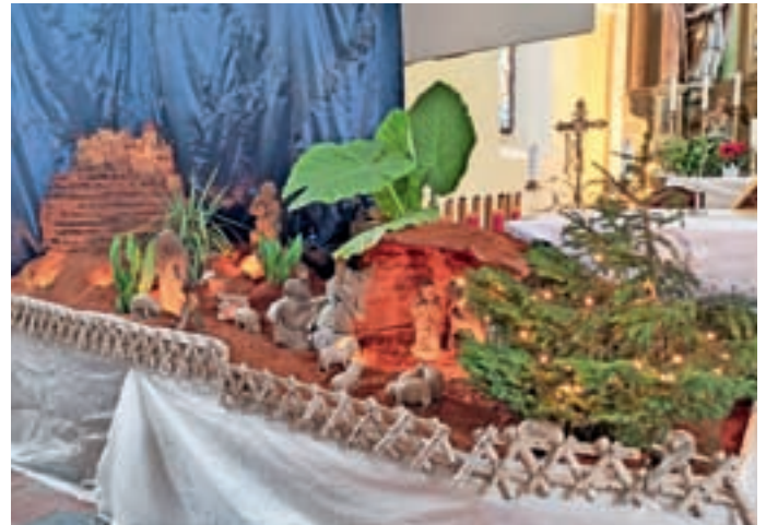
Jaslice v cerkvi sv. Janeza Krstnika na Trati v Gorenji vasi so tokrat dobile bolj orientalski pridih, saj so gorenjevaški jasličarji namesto standardnega mahu za oblikovanje pokrajine uporabili oranžni pesek.