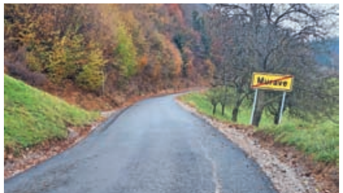
Uredili so tudi sedemstometrski odsek na cesti Murave–Podvrh.