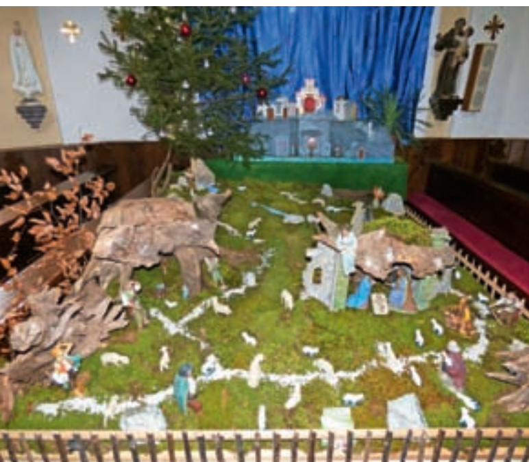
Jaslice v cerkvi sv. Pavla v Stari Oselci zavzemajo mesto na sredi ladje.