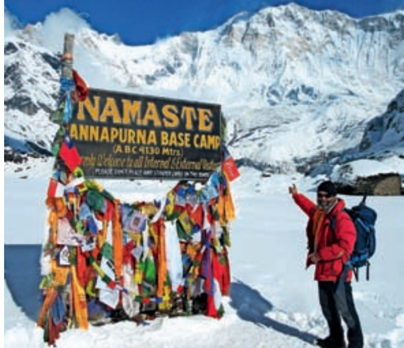
Na cilju poti, v baznem taboru pod Anapurno na nadmorski višini 4130 metrov