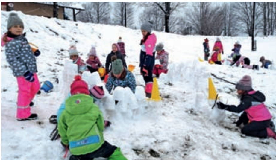
Zimske radosti na Medvedjem Brdu

Sedmošolci so pet dni preživeli v pravljicni deželi pod Karavankami – v Centru šolskih in obšolskih dejavnosti Trilobit v Javorniškem Rovtu. Obiskali so izvir Velikega Javornika, spoznali fosile in jih odlili v mavec. Ponovili so osnove orientacije, se učili spretnosti oblikovanja osnovnih